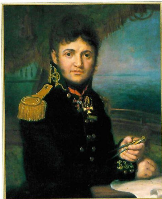
В. Л. Боровиковский. Портрет адмирала Ю. Ф. Лисянского. 1810 г.