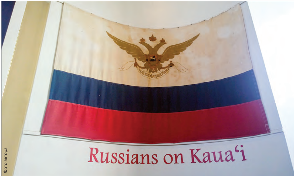
Флаг Российско-Американской компании, выставленный в Музее Кауаи в экспозиции, посвященной «русскому периоду» острова

Но главное слово было за МИД. Сообщая в феврале 1818 года об окончательном решении Александра I по вопросу о Сандвичевых островах, Нессельроде отчетливо заявил: «Государь император изволил полагать, что приобретение сих островов и добровольное их поступление в его покровительство не только не может принести России никакой существенной пользы, но, напротив, во многих отношениях сопряжено с весьма важными неудобствами. И потому Его величеству угодно, чтобы королю Томари, изъявля всю возможную приветливость и желание сохранить с ним приятельные сношения, от него помянутого акта не принимать, а только ограничиться постановлением с ним вышеупомянутых благоприятных сношений и действовать к распространению с Сандвичевыми островами торговых оборотов Американской компании, поелику оные сообразны будут сему порядку дел». Министру внутренних дел О.П.Козодавлеву поручалось довести это решение до сведения компании и «дать ей предписание, чтобы она от такового правила не отступала».