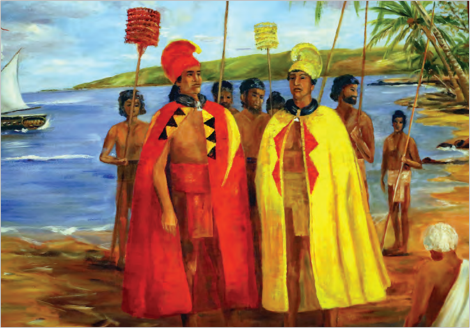
Король Кауаи Каумуалии, которого русские называли «Томари», со своим злейшим врагом - королем Камеамеа. Картина, выставленная в Музее Кауаи

говоренность между двумя королями или нет? Безусловно одно: на момент прибытия на остров русских Кауаи оставался де-факто независимым, Каумуалии продолжал править своим «обособленным королевством», находившимся на крайнем западе Гавайев, словно на отшибе. Конфликт, как бы сейчас сказали, перешел в разряд «замороженных».