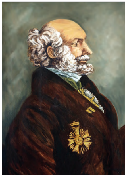
Георг Шеффер. Портрет, выставленный в Музее Кауаи

Но изучение дневниковых записей Шеффера, которые он вел на Кауаи, а также записка, представленная им Александру I, «о выгодах, приобретаемых Россией в случае ее укрепления на Сандвичевых островах», оставляют впечатление о нем как о человеке острого ума и преданного интересам России: «В отношении политическом: доставление надлежащего покровительства российским заморским владениям зависит от приобретения надежного места в южном море. Должна ли Россия стараться вступить вновь в то владение? Сего требует и честь и польза ее. Ей должно занять Атувай со всеми прочими островами. Занятием Сандвичевых островов Россия обеспечивает себе возможность производить ей одной торг мехами на северо-западном берегу и воспрепятствует американцам оным пользоваться, но как сии острова, так и заведения России и торговля ее без оных будут для ней потеряны в сих странах света...».