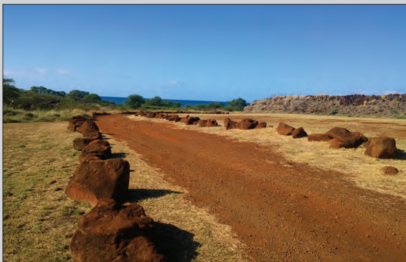
Путь к крепости Елисавета