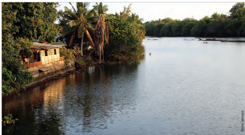
Река Хананепе на острове Кауаи. Во время русского правления на острове она была переименована в Дон

ское озеро». Сохранили архивы и объяснения того, почему император Александр I решил, что такой поворот будет не в интересах России.