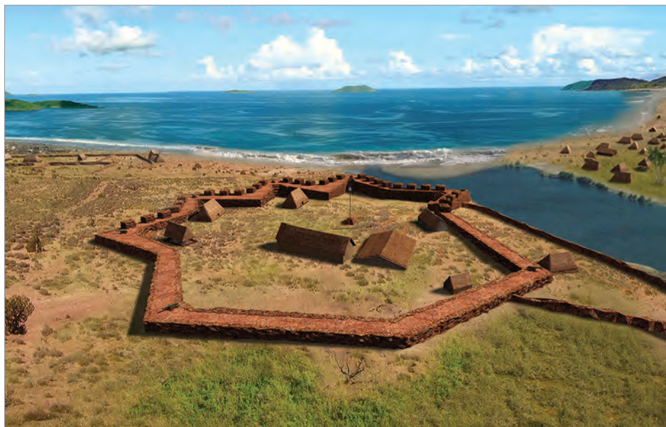
Реконструкция крепости Елисавета, выполненная к 200-летию с ее основания. Проект Александра Молодина, Новосибирск

В 1898 году все Гавайские острова, включая Кауаи как (кстати, и предсказывал Шеффер), будут аннексированы Соединенными Штатами - шаг, легитимность которого до сих пор оспаривает ряд