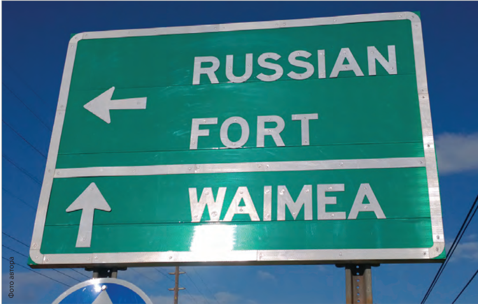
«Русский Форт» - такой знак с удивлением видят туристы, проезжая по южному берегу Кауаи

Российский флаг был спущен, и на его месте развевался уже какой-то иной, непонятный флаг. Шестеро американских матросов схватили Шеффера и затолкали на русский корабль «Кадьяк», стоявший на юго-западе острова, в устье реки Ваймеа, рядом с крепостью Елисавета. Шеффер попытался обойти остров и причалить на севере, в «своем поместье» Ханалеи, но узнал, что двое его верных алеутов, ждавших на берегу, были убиты, и навсегда покинул Кауаи 41 .