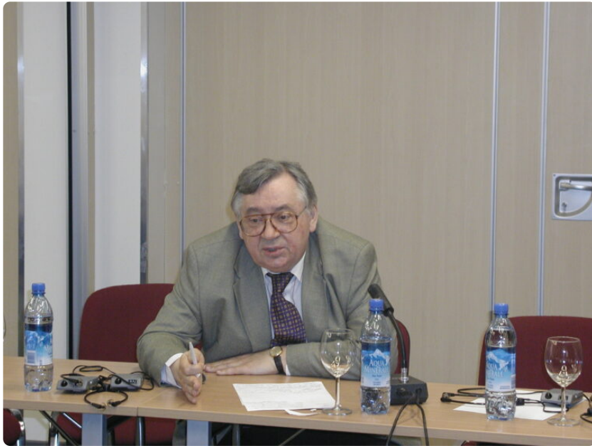
Совместный российско-американский семинар «Северная Корея и Глобальное партнерство против распространения ОМУ». 13 апреля 2005 г.

в Царском Селе. Окончил Ленинградский государственный университет. Выучил хинди. Работал в советском посольстве в Пакистане и в других странах, а также в секретариате ООН. Участвовал в переговорах по разоружению, в выработке соглашений по правам человека. Свободно владею английским и немецким языками».